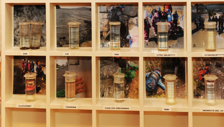
Hyller med vannprøver, som barna har samlet inn i forbindelse med prosjekt om vann.