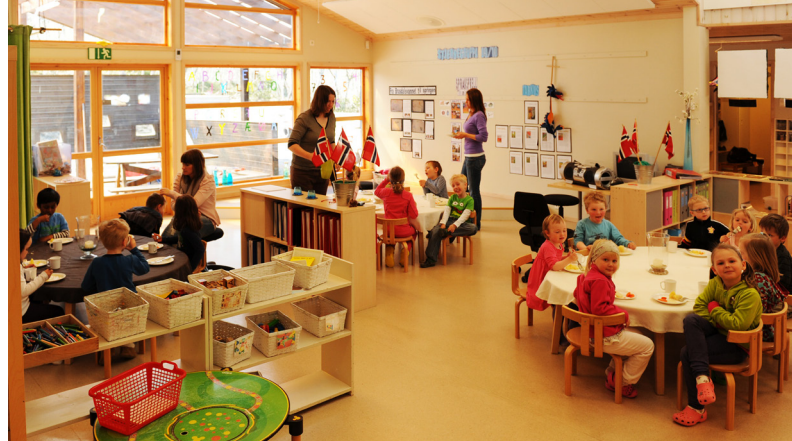
I aktivitetsrommet møtes alle aldergrupper.

dokumenteres prosessene i form av tegninger, bilder, ting de lager og for eksempel innsamlet materiale fra turer i skog og mark. Innredningen tar særskilt hensyn til at alle disse tingene kan stilles ut i egne montre, hyller og skap, spesielt designet til formålet, og tilgjengelig for alle, slik at barna selv, personalet og foreldrene kan følge med på fremgangen i prosjektene og prosessene underveis.