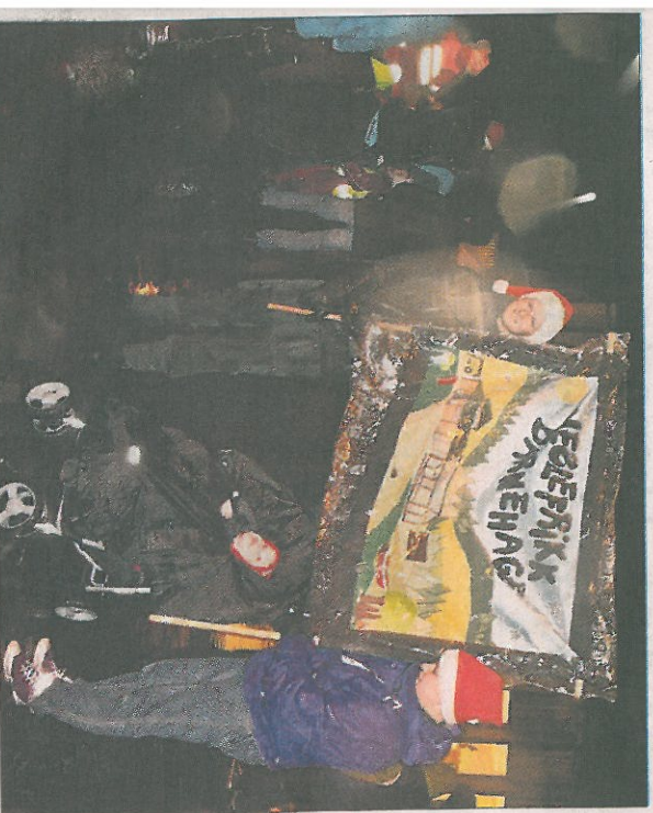
MANGE DELTOK. Både barn og voksne var på beina da årets store adventsparade fant sted i Spjelkavik.

-Barn og voksne deltok i adventsparaden i Spjelkavik.